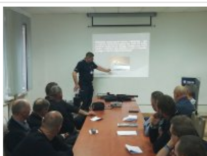
KPP w Łęczycy