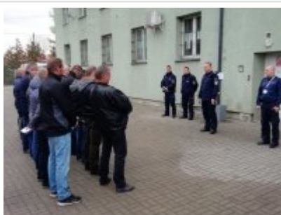
KPP w Łęczycy