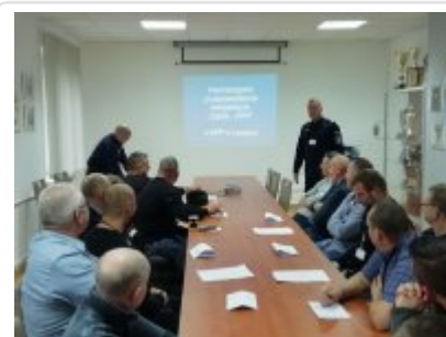
KPP w Łęczycy